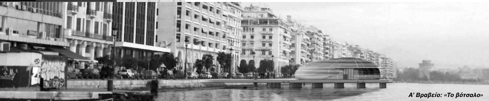
Α' Βραβείο: «Το βότσαλο»