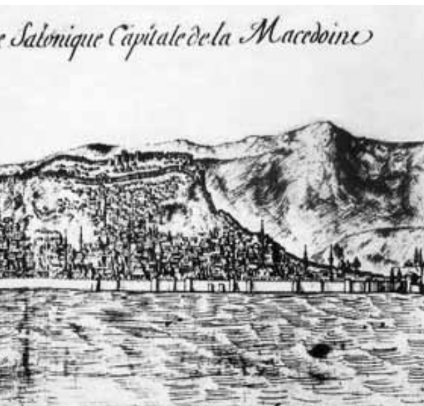
Τα τείχη από τη θάλασσα, από χαλκογραφία του 16ου αιώνα