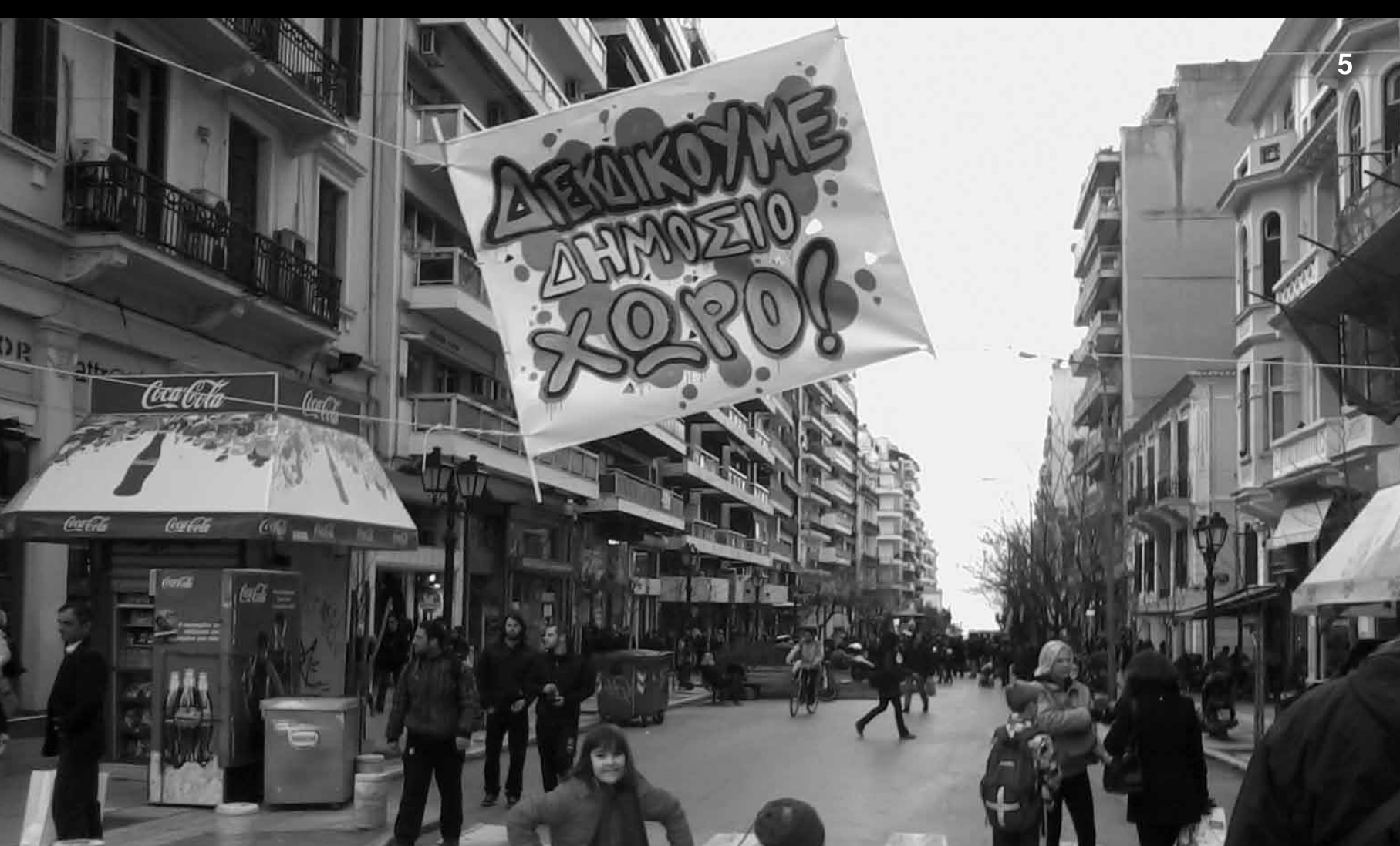
Η διεκδίκηση του δημόσιου χώρου

πολυπολιτισμικό παρελθόν της πόλης είναι μόνο μερικά παραδείγματα που κατ' αρχήν προκαλούν συζητήσεις για τον ίδιο το ρόλο της τοπικής αυτοδιοίκησης και των κατοίκων στη συγκρότηση της σύγχρονης ζωντανής φυσιογνωμίας της πόλης.