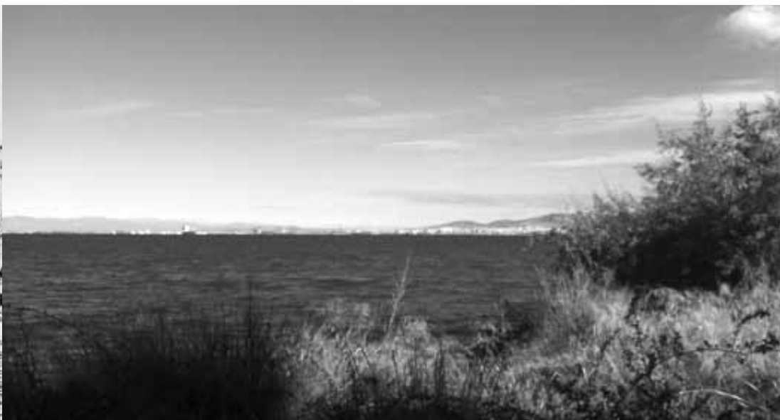
Άποψη της σύγχρονης ακτογραμμής της πόλης από το Καραμπουρνάκι

Η σύγχρονη δυναμική του αστικοποιημένου τοπίου της Θεσσαλονίκης, ως τυπικού παραδείγματος μεσογειακής πόλης με τα συνηθισμένα προβλήματα υπερδόμησης και το μικρό ποσοστό ανοικτών χώρων ανά κάτοικο, είναι σημαντικό να επανασχετιστεί με τα ιδιαίτερα χαρακτηριστικά και την ιστορικότητα της γεωφυσικής επιφάνειας στην οποία η πόλη είναι εγκατεστημένη, και όχι μόνο. Με τη φυσική τοπογραφία της ευρύτερης περιοχής να μη διευκολύνει τη συνδεσιμότητα από τις ανατολικές προς τις δυτικές αστικές διευρύνσεις, αναδύεται η αναγκαιότητα ανίχνευσης δικτύων υπαίθριων χώρων ικανών να αποκαταστήσουν, στο μέτρο του δυνατού, τις φυσικές συνέχειες. Οι διαθέσιμες μελέτες για την ιστορία του επανασχεδιασμού της πόλης μετά την πυρκαγιά του 1917 και η αλληλουχία των σχεδίων ανοικοδόμησης έχουν καταγράψει μια σειρά σημαντικών προβλέψεων για την αναδιάρθρωση του υπαίθριου χώρου. Ανάμεσα στα σημαντικά στοιχεία των σχεδίων είναι η γεωγραφική προσέγγιση και ο συσχετισμός του υπαίθριου χώρου της πόλης με την περιβάλλουσα φύση. Εκτεταμένες ζώνες ελεύθερων χώρων προέβλεπαν την ενοποίηση ή το διαχωρισμό των προτεινόμενων λειτουργικών ζωνών και των επιμέρους περιοχών του αστικού οργανισμού της Θεσσαλονίκης.