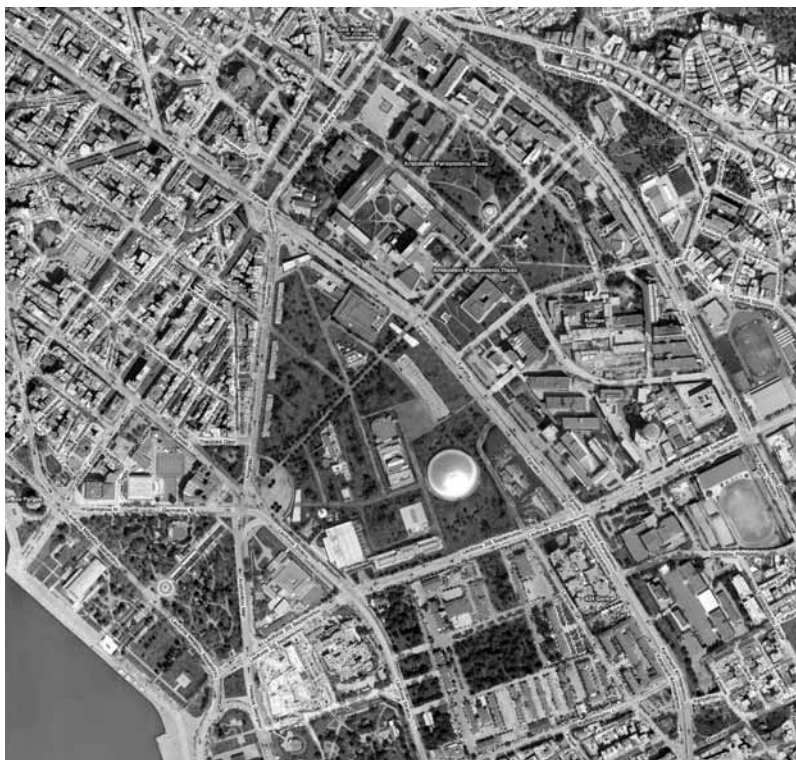
Εικ. 1. Γενική διάταξη των προτεινόμενων παρεμβάσεων στο χώρο της ΔΕΘ (βλ. σημ. 1)