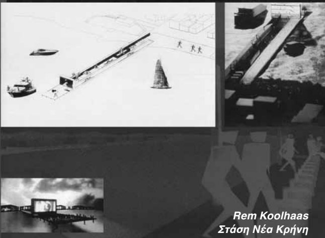
Rem Koolhaas Στάση Νέα Κρήνη