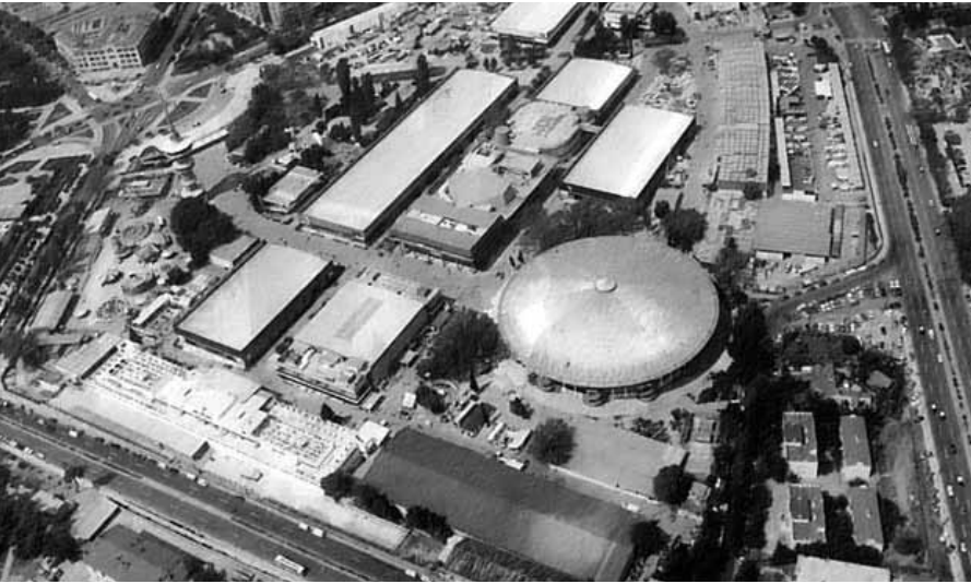
Αεροφωτογραφία του χώρου της Διεθνούς Έκθεσης Θεσσαλονίκης (1966)

συχνά αντικρουόμενα, σε κάθε περίπτωση περιοριστικά, πλαίσια, τα οποία έχουν συνήθως κανονιστικό, νομοθετικό αλλά και πολεοδομικό και χωροταξικό χαρακτήρα. Οι περισσότερες εκπονούνται σε μεγάλο βαθμό σε ακαδημαϊκό περιβάλλον και είναι είτε αποτέλεσμα διεξοδικών ερευνητικών προγραμμάτων είτε προτάσεις στα πλαίσια εκπόνησης διπλωματικών εργασιών, είτε ακόμη και εργασίες φοιτητικών συνθετικών εργαστηρίων αρχιτεκτονικού και αστικού σχεδιασμού.