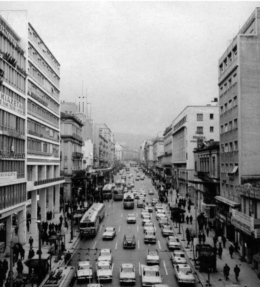
Η οδός Πανεπιστημίου το 1968