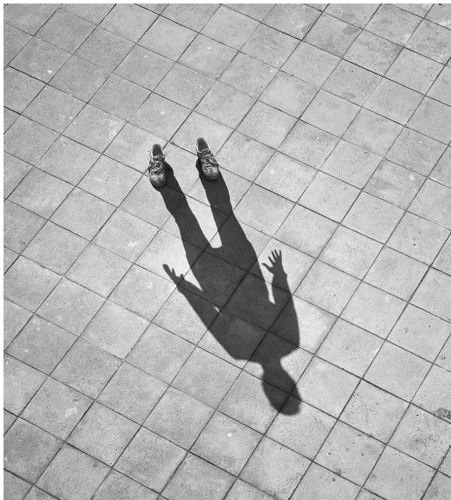
...το φοβικό περιβάλλον διαβρώνει τον ψυχισμό μας... (από τη σειρά «I'm not There»)

MIET, 2001). Όμως, ποιος είναι ο ρόλος της ύλης όταν αυτή δεν είναι το μέσον αλλά ο αυτοσκοπός; Σε αντανάκλαση αυτού που παρατηρείται στο δομημένο περιβάλλον, η κλίμακα των στόχων και των παραγόντων που τους διαμορφώνουν αλλοιώνεται. Τα οικονομικά μεγέθη αντικατοπτρίζονται παντού, οι πλασματικές ανάγκες διογκώνονται, τα ιδανικά μπαίνουν σε δεύτερη μοίρα. Ξεχνάμε σε ποια χώρα ζούμε, με ποια μεγέθη έχουμε να κάνουμε.