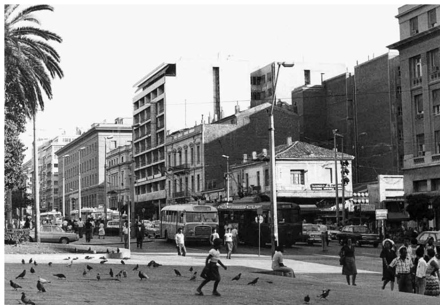
Η οδός Πανεπιστημίου τη δεκαετία του '70

Έχω κατηγορηθεί για αρνητισμό, ακολουθώντας την «εύκολη», υποτίθεται, επιλογή του όχι στο συγκεκριμένο αλλά και σε άλλα αντίστοιχα μεγάλα σχέδια. Λέω όχι στις βεβαιότητες του κ. Π. Τουρνικιώτη που υποστηρίζει το σχέδιο, γιατί το καλύτερο αρχιτεκτονικό περιβάλλον δεν θα κάνει ζωντανό το κέντρο για όλους/ες και όλες τις ώρες, η βιώσιμη κινητικότητα είναι ανέκδοτο όταν υλοποιείται σε έναν μικρό άξονα, ο περιορισμός του αυτοκινήτου δεν είναι αυτοσκοπός, το τραμ δεν είναι πάντα η καλύτερη λύση σε σχέση με λεωφορεία και τρόλεϊ και η Αθήνα δεν θα γίνει καλύτερη αν φυτέψουμε δένδρα στην Πανεπιστημίου αδιαφορώντας για την κοινωνία και την οικονομία που καταρρέει. Μια μεγάλη αστική εφημερίδα έγραφε