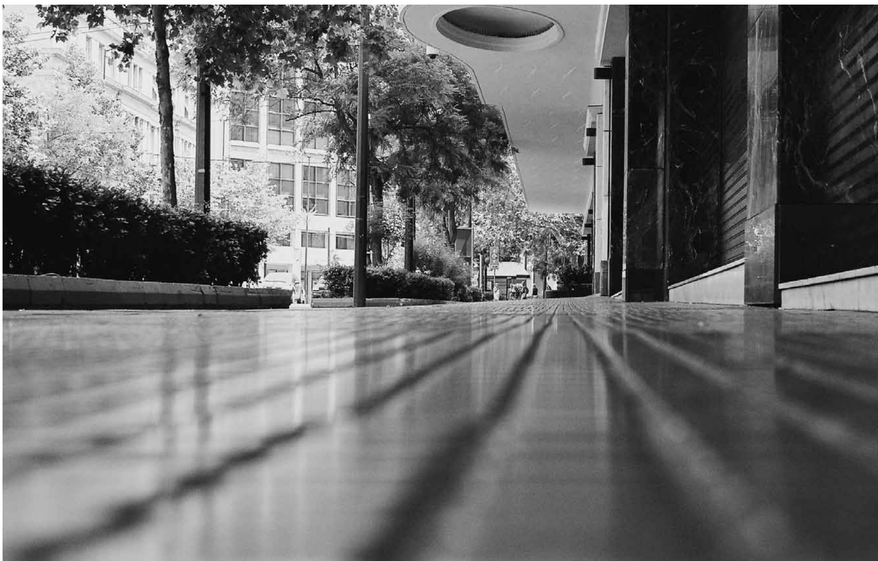
Οδός Πανεπιστημίου. Το πεζοδρόμιο μπροστά από το Zonars, φωτ. Κώστας Ράντος, 2010

για την Πανεπιστημίου: «... η Αθήνα ποντάρει να ετοιμάσει τη βασική ιδεολογική και κτηριακή υποδομή που θα υποδεχτεί το τέρμα της ύφεσης τα προσεχή χρόνια». Περί αυτού πρόκειται: μια πολιτική, ιδεολογική και συντηρητική επίθεση στους λαϊκούς χώρους-τοπόσημα του κέντρου, να τελειώνουν με τις μνήμες και τους χώρους των δημοκρατικών αγώνων της πόλης και παράλληλα να προετοιμαστούν για οικειοποίηση της γαιοπροσόδου από την άνοδο των αξιών γης και τις αλλαγές στις χρήσεις των κτηρίων.