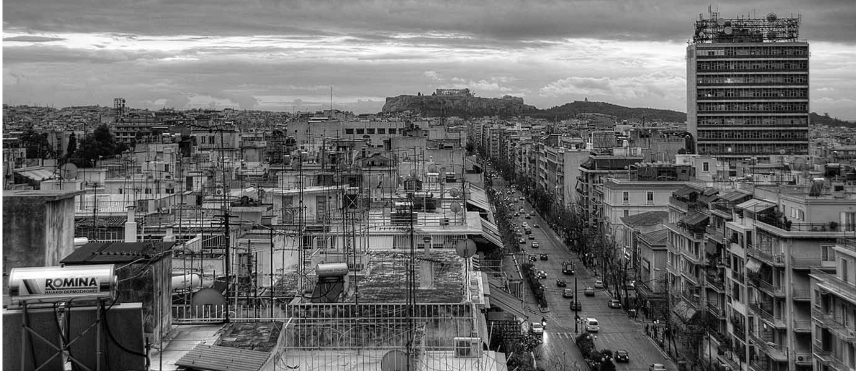
Πατησίων και Άνδρου, φωτ. Δημήτρης Μπούρας

απόγνωση, παραίτηση και διάθεση φυγής, ένα πειστικό ερώτημα δεν έχει καν τεθεί: Γιατί αυτή η πόλη παράγει τόσους τοξικομανείς, αστέγους και απελπισμένους, και δημιουργείται η ανάγκη να χρησιμοποιηθεί κάθε διαθέσιμη επιφάνειά της για να εκφραστούν οι πολίτες της; Σε μια αναπασμένη Αθήνα, τι είναι αυτό που θα προσφέρει καλύτερους όρους μέριμνας σε όλους αυτούς που αυτή τη στιγμή νοσούν; Δεδομένης της ευθύνης των επιλογών για την πόλη, οι συνέπειες των οποίων θα συνοδεύουν πολλές γενιές, ανακύπτει το θεμελιώδες ερώτημα ποιος και με τι μηχανισμούς αποφασίζει. Μια βασική κριτική για τη σημερινή χάρση πολιτικής σχετικά με το μέλλον της Αθήνας μέσω του Rethink Athens και άλλων σχεδίων που συζητιούνται, ανεξάρτητα από το αν απαντούν ή όχι σε πραγματικά πολεοδομικά ζητήματα της πόλης, είναι σε επίπεδο μηχανισμών που επιστρατεύονται και διαδικασιών που υιοθετούνται, που δεν λαμβάνουν πραγματικά υπόψη τους τους ανθρώπους στο σχεδιασμό. 3