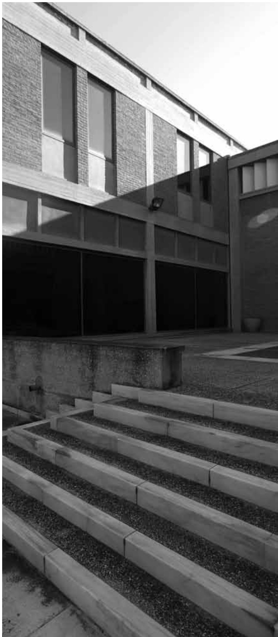
Άποψη της εσωτερικής αυλής του Βυζαντινού Μουσείου Θεσσαλονίκης του αρχιτέκτονα Κυριάκου Κρόκου

Συμμετρικός κι όμως ασύμμετρος (παρατηρήστε τη μεταμόρφωση των συμπαγών Γ σε τριάδες υποστηλωμάτων στην εξωτερική όψη του κτηρίου) ρυθμικός σκελετός πολυκατοικίας του αρχιτέκτονα Γιώργου Αγγελή (2012) στην οδό Δεινοκράτους, Αθήνα