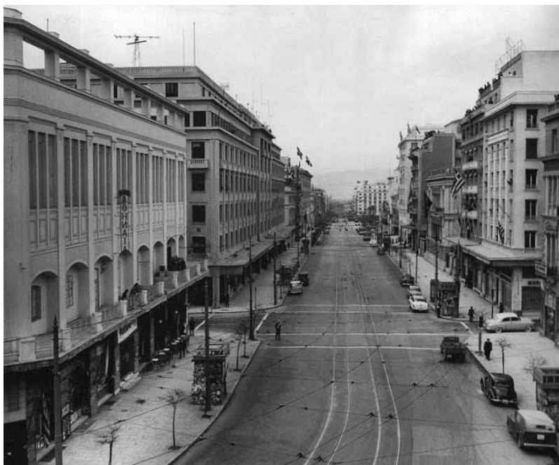
Η οδός Πανεπιστημίου τη δεκαετία του '50

Όταν είχε παρουσιαστεί πρώτη φορά η έρευνα των συναδέλφων του ΕΜΠ για την αναζήτηση της «νέας κεντρικότητας» στην Αθήνα και πώς αυτή θα ενισχυθεί με την πεζοδρόμηση της Πανεπιστημίου, είχα διατυπώσει μεγάλες επιφυλάξεις για τρεις κυρίως λόγους. Πρώτον, γιατί αναζητούσαν κάτι που ήδη υπάρχει και δεν χρειαζόταν ιδιαίτερη τεκμηρίωση: το ιστορικό κέντρο της Αθήνας δεν έχει μετακινηθεί. Δεύτερον, η φυγή των μόνιμων κατοίκων από το ιστορικό κέντρο δεν οφείλεται κυρίως στην υποβάθμιση του αστικού περιβάλλοντος. Και τρίτον, η όλη προσέγγιση του προβλήματος ήταν μονομερώς «αρχιτεκτονική», με ανεπαρκείς αναφορές στους κοινωνικούς, οικονομικούς και πολιτικούς λόγους της σταδιακής απαξίωσης του ιστορικού κέντρου. 1