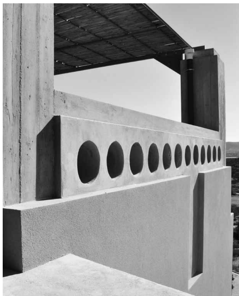
Διαδοχικές επικαλύψεις του σκελετού· η επιδερμίδα κατοικίας στο Μαρκόπουλο (2012)

Κωνσταντινίδη, το δάπεδο και τα σκαλιά του σκελετού παραμένουν δάπεδο και σκαλιά του κτίσματος – τουλάχιστον στο υπόστεγο που συνδέει τις δυο μικρές πτέρυγες. Σ' όλες τις άλλες περιπτώσεις που γνωρίζω, η ανάγκη βιάζει ακόμη και τους πιο ακραιφνείς λάτρεις του Ειλικρινούς να καλύψουν τα δάπεδα, ώστε να κρύψουν τις εγκαταστάσεις, να εξομαλύνουν τις επιφάνειες, να παραγάγουν λειτουργικά τελειώματα και ούτω καθεξής. Σαν να ήταν φυσικό! Όσο, μάλιστα, οι ανάγκες της ζωής(;) πολλαπλασιάζονται κι όσο τα προβλήματα που τίθενται γίνονται περισσότερα και περιπλοκότερα, τόσο ο αρχιτέκτονας δυσκολεύεται και δυσανασχετεί. Βλέπει πως έρχεται η ώρα των υπολοίπων στοιχείων του σκελετού να